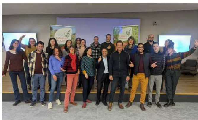
L'équipe au comité de pilotage 2024 du LIFE