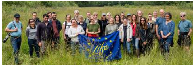
Toutes les équipes LIFE étaient ravies des échanges !

Cet échange enrichissant a nourri la réflexion et ouvert de nouvelles perspectives pour le développement de l'agriculture durable.