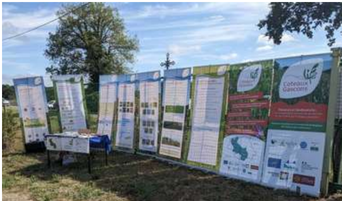
Le LIFE Coteaux Gascon s'expose !

Afin de faire connaître le projet LIFE Coteaux Gascons et de diffuser les connaissances sur la préservation et la valorisation des milieux agro-pastoraux liés à une activité d'élevage extensif à l'herbe, une exposition composée de 11 roll-up a été réalisée. Cette exposition itinérante et gratuite peut être prêtée et installée dans divers lieux.