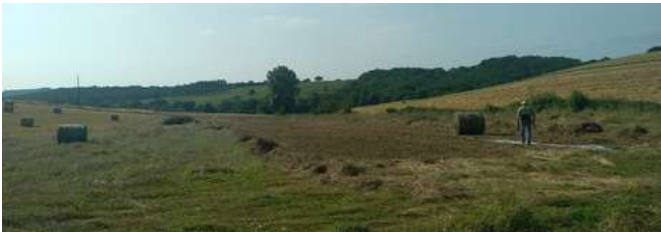
Nous déroulons le tapis vert pour implanter une nouvelle prairie

Approchant de la retraite, elle a aussi sollicité un accompagnement dans son projet de transmission pour avoir une idée précise de la valeur de ses biens et avancer dans sa recherche de repreneur de manière sereine, tout en favorisant la préservation de la biodiversité.