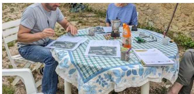
Signature du bail autour d'un café !

1er cas : l'arrêt du fermage pour raisons personnelles sur des parcelles en prairies, pelouses sèches et landes, historiquement pâturées, pose la question de la continuité dans la gestion et la mise en valeur de ces parcelles. Un accompagnement foncier des propriétaires et des candidats a été mené, incluant la signature d'un bail rural à clauses environnementales et la réalisation d'un diagnostic agroécologique en vue de restaurer certaines parcelles.