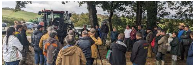
Des participants attentifs et des intervenants passionnés

Parmi ces rencontres, une journée technique sur la restauration des prairies et l'entretien des bords de parcelles a été organisée le 26 octobre 2023 à Labéjan. Les thématiques abordées, telles que l'amélioration des prairies et les techniques d'entretien, ont fait l'objet de discussions approfondies entre intervenants et participants. L'intervention du LIFE a permis, non seulement d' échanger sur les aspects techniques , mais aussi de sensibiliser les participants à l'importance de ces pratiques.